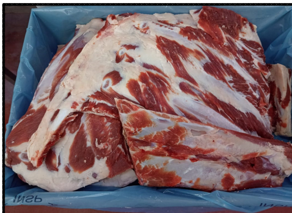
Imágenes meramente ilustrativas / Images only for illustration